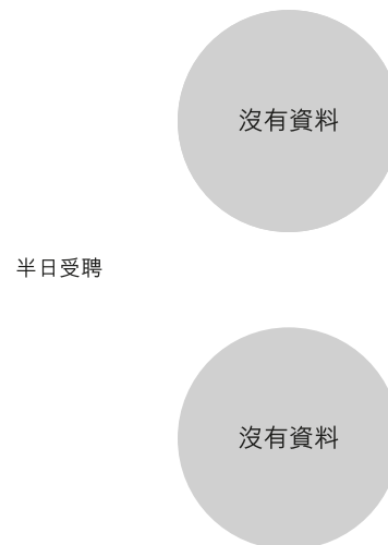
校長及教學人員幼兒教學年資 (2019年3月資料)