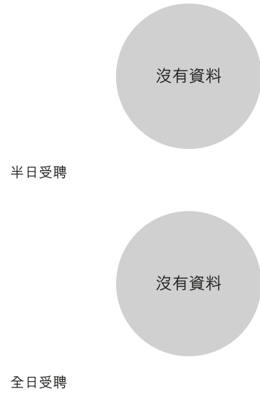
校長及教學人員幼兒教學年資 (2019年3月資料)