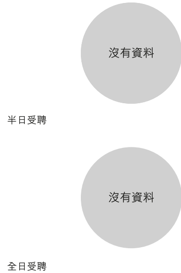
校長及教學人員幼兒教學年資 (2019年3月資料)